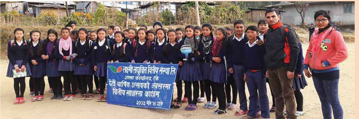
संस्थाद्वारा आयोजित वित्तीय साक्षरता कार्यक्रममा सहभागी विद्यार्थीहरू