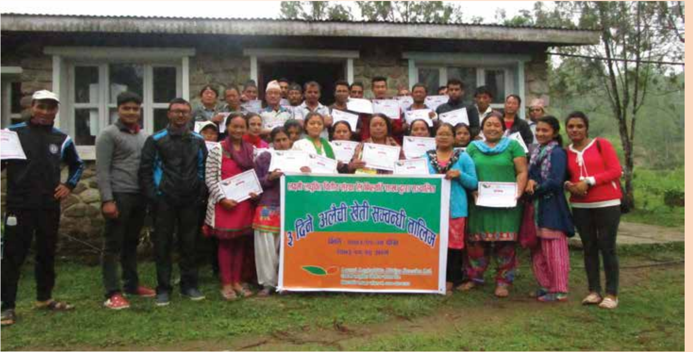
व्यवसायिक अलैंची खेती तालिममा सहभागी ग्राहक सदस्यहरू