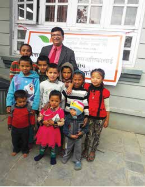
अनाथ बालबालिकाहरूसँग प्रमुख कार्यकारी अधिकृत