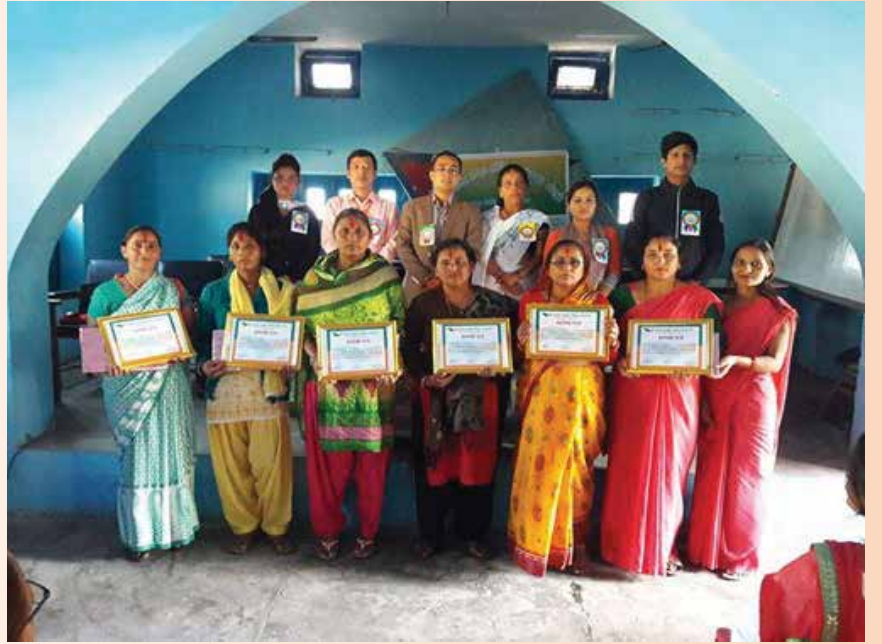
वार्षिक केन्द्र प्रमुख कार्यशाला गोष्ठीमा पुरस्कृत केन्द्र प्रमुखहरू